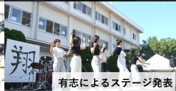
有志によるステージ発表