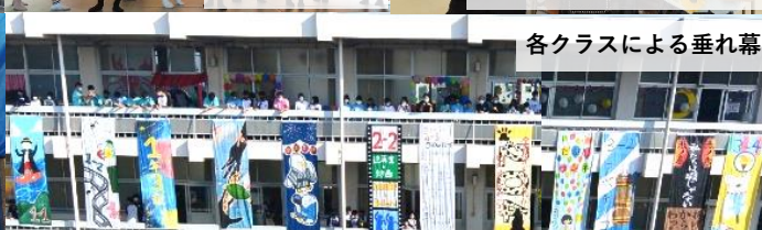
各クラスによる垂れ幕