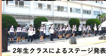
2年生クラスによるステージ発表