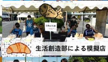
生活創造部による模擬店