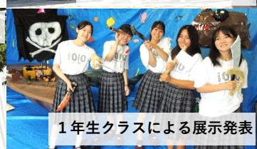
1年生クラスによる展示発表