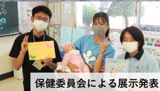
保健委員会による展示発表