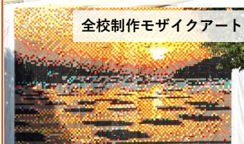
全校制作モザイクアート