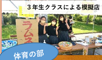
3年生クラスによる模擬店