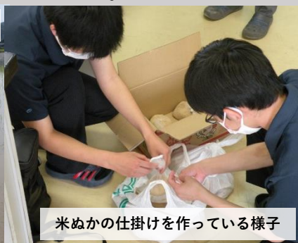
米ぬかの仕掛けを作っている様子