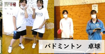
バドミントン 卓球

今年の千町祭はコロナの影響で制限された中での実施でしたが、生徒のみなさんや先生方のおかげで無事成功で終わることができました。私にとっては最後の千町祭でしたが、自分にできることを精一杯やり遂げることができました。来年はコロナも収まり、今年以上にいい千町祭にしてくれることを後輩に託したいと思います。