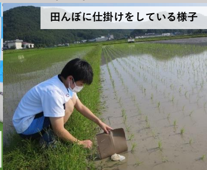
田んぼに仕掛けをしている様子