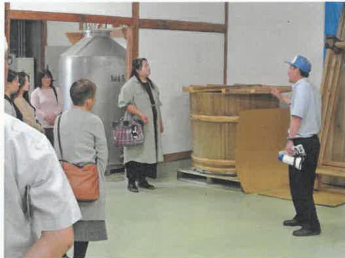
平喜酒造にて酒造りの説明中。