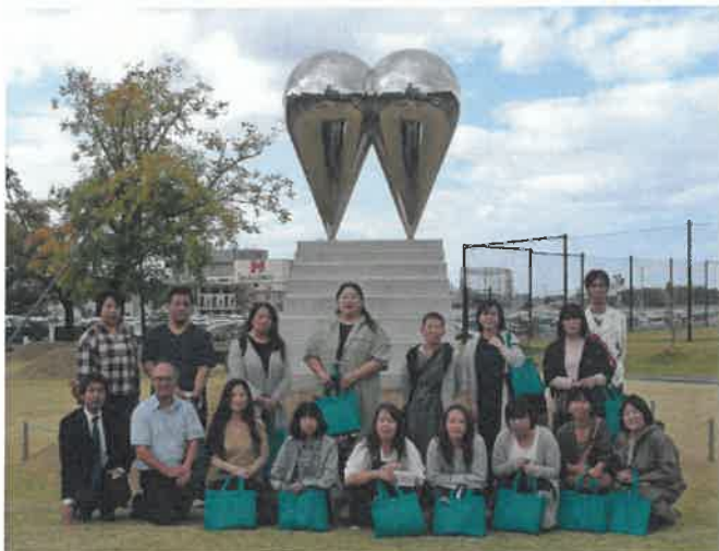
川崎医療福祉大学モニュメント前で。

本校では、PTA研修旅行を10月15日に行った。例年の内容は、大学訪問、合格祈願、観光地見学、昼食会での親睦等である。今年度は、川崎医療福祉大学を訪問し、広報の方に大学の説明、及びキャンパスの案内をしていただいた。その後笠岡で昼食をとり、道の駅笠岡ベイファームで買い物と一面のコスモスを楽しんだ。最後に浅口市鴨方町にある平喜酒造を見学し、近代化された設備と昔からの酒造りの違いやこだわりを聞き、楽しい一日となった。(過去の行き先は、平成26年度は鳥取方面、平成27年度は福山方面、平成28年度参加者不足のため中止、平成29年度は関西方面、平成30年度は淡路島方面であった。)