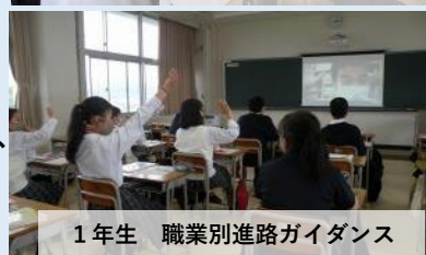
1年生 職業別進路ガイダンス

6月4日(金)1年生全員が14の講座にわかれ、職業別進路ガイダンスを受講しました。今回はオンラインで各校と会場を結んでリモートでのガイダンスとなりました。リモートでの開催のため、一方的な説明になるのかと危惧していましたが、各学校さんも画面と音声を通じて双方向のやり取りをしながらの説明をしてくださいました。生徒の感想の中には「営業職や販売職はコミュニケーション能力が必要となってくるので今から身につけていこうと思った。」「ホテルもブライダルも人に幸せになってほしいという思いが詰まったお仕事だったのでとても気になる。」といったものがあり、今回のガイダンスが自分自身の進路について考えるよいきっかけとなったことがうかがわれました。