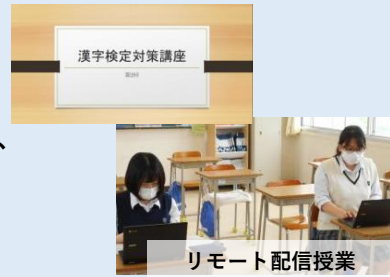
リモート配信授業

6月5日(土)に土曜活用講座が行われ、漢字検定講座では、パソコンを使って、教室や自宅からリモートで参加する授業が行われました。パソコン上で共有された画面で先生のスライドを見ながら説明を受けたり、漢字検定のサイトで問題にチャレンジしたりしました。みんなで選択問題を考え、級ごとの問題にチャレンジし検定に向けて充実した学習になりました。漢字検定は26日(土)に実施予定です。