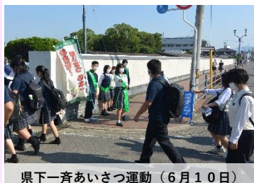
県下一斉あいさつ運動(6月10日)

1つ目は挨拶です。挨拶は大切なコミュニケーションであり、 学校内はもちろん、地域の方々へも積極的にしていきたいと考 えています。そして、これからも地域との繋がりを大切 にして、よりよい関係を築いていきたいです。