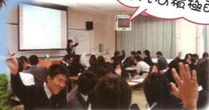
●コミュニケーション講座