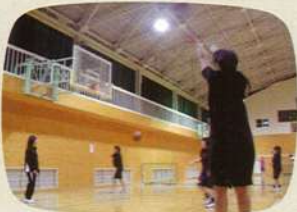
●バスケットボール