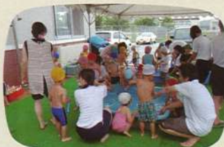
●夏のボランティア