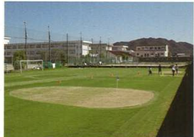
ニュースポーツ 3年